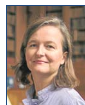
Mme Nathalie Loiseau Directrice de l'École Nationale d'Administration