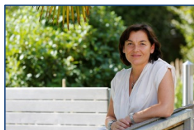
Madame Annick Girardin