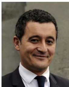
Gérald DARMANIN Ministre de l'Action et des Comptes publics