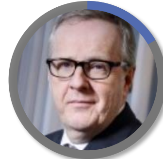
Thierry LE GOFF,

Délégué interministériel à la transformation publique (DITP)